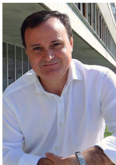
D. Ángel Viveros Gutiérrez Alcalde de Coslada